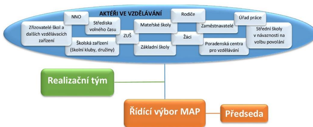
Obr. 1: Organizační schéma MAP SO ORP Rosice

Mezi hlavní úkoly realizačního týmu patří: